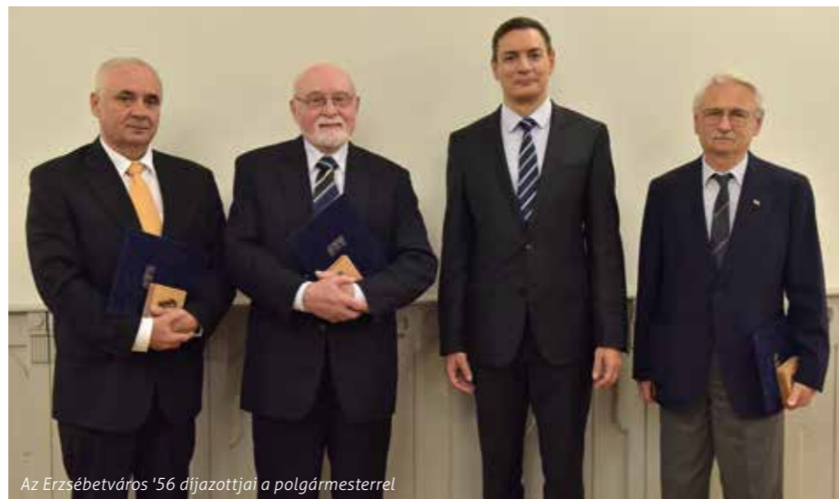
Az Erzsébetváros '56 díjazottjai a polgármesterrel

Idén először kitüntették a kerületi hősokeket, Erzsébetváros ugyanis megalapította az Erzsébetváros '56 díjat, melynek köszönhetően az 1956-os forradalom és szabadságharc résztvevői és hősei az őket megillető elismerésben részesülhetnek, továbbá a forradalom és szabadságharc szellemi örökségét Erzsébetváros polgárai és a jövő generációi számára továbbadó személyekkel, szervezetek munkájával szemben is méltóképp fejezheti ki megbecsülését az önkormányzat.