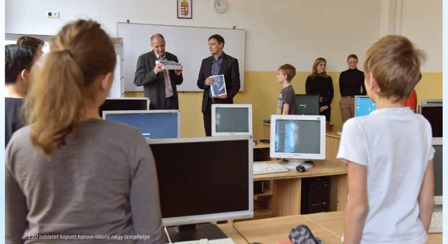
120 tabletet kapott három iskola négy telephelye

Erzsébetváros önkormányzata az eszköztámogatás mellett felmérte a kerületi iskolák internethálózatának minőségét és állapotát, mert a jövőbeli tervek között szerepel, hogy ahol szükséges, korszerűsítsék és hatékonyabbá tegyék az internetelérést.